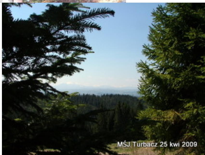
MŚJ Turbacz 25 kwi 2009