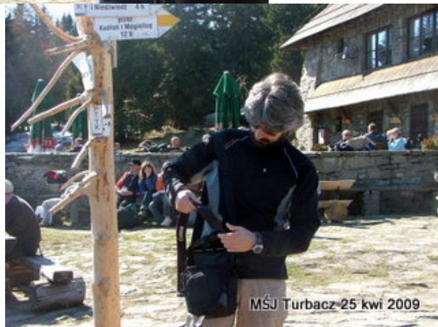
MŚJ Turbacz 25 kwi 2009