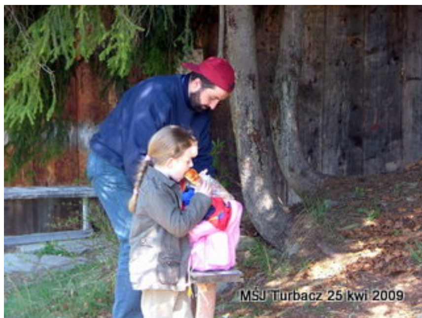
MŚJ Turbacz 25 kwi 2009