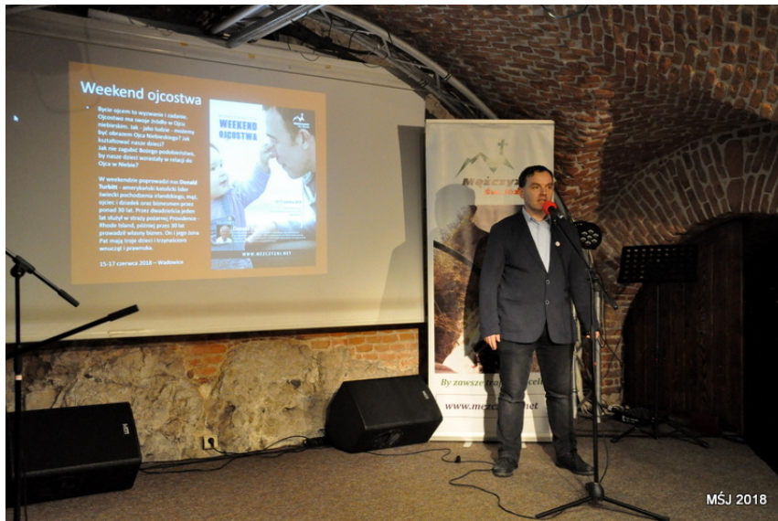
Transmisja ze spotkania...