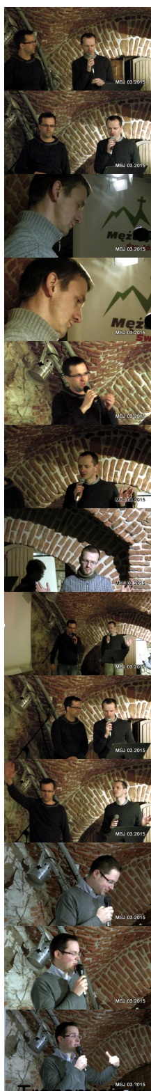
Transmisja live - zapis